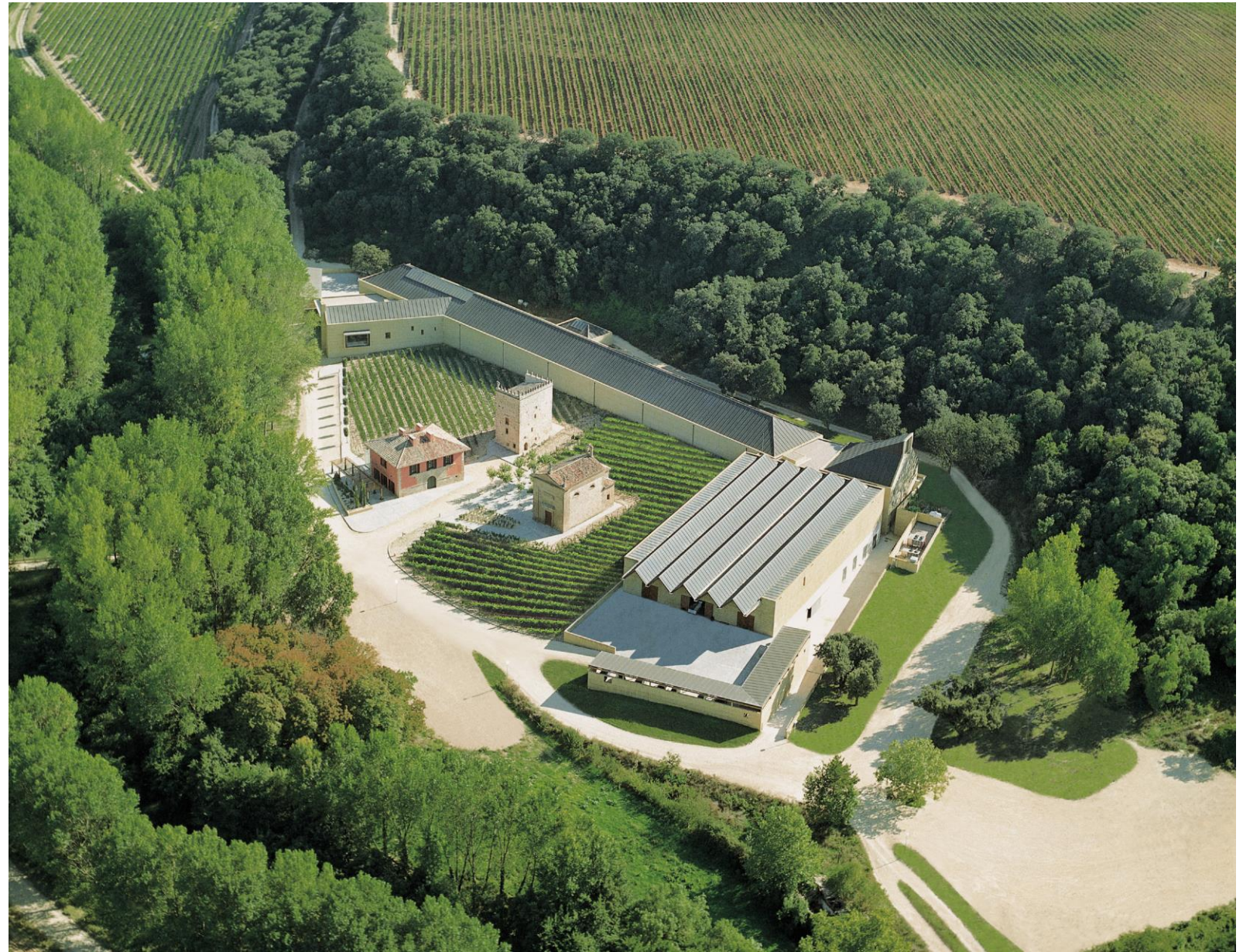
Tesoros de arquitectura, legado de Rafael Moneo...