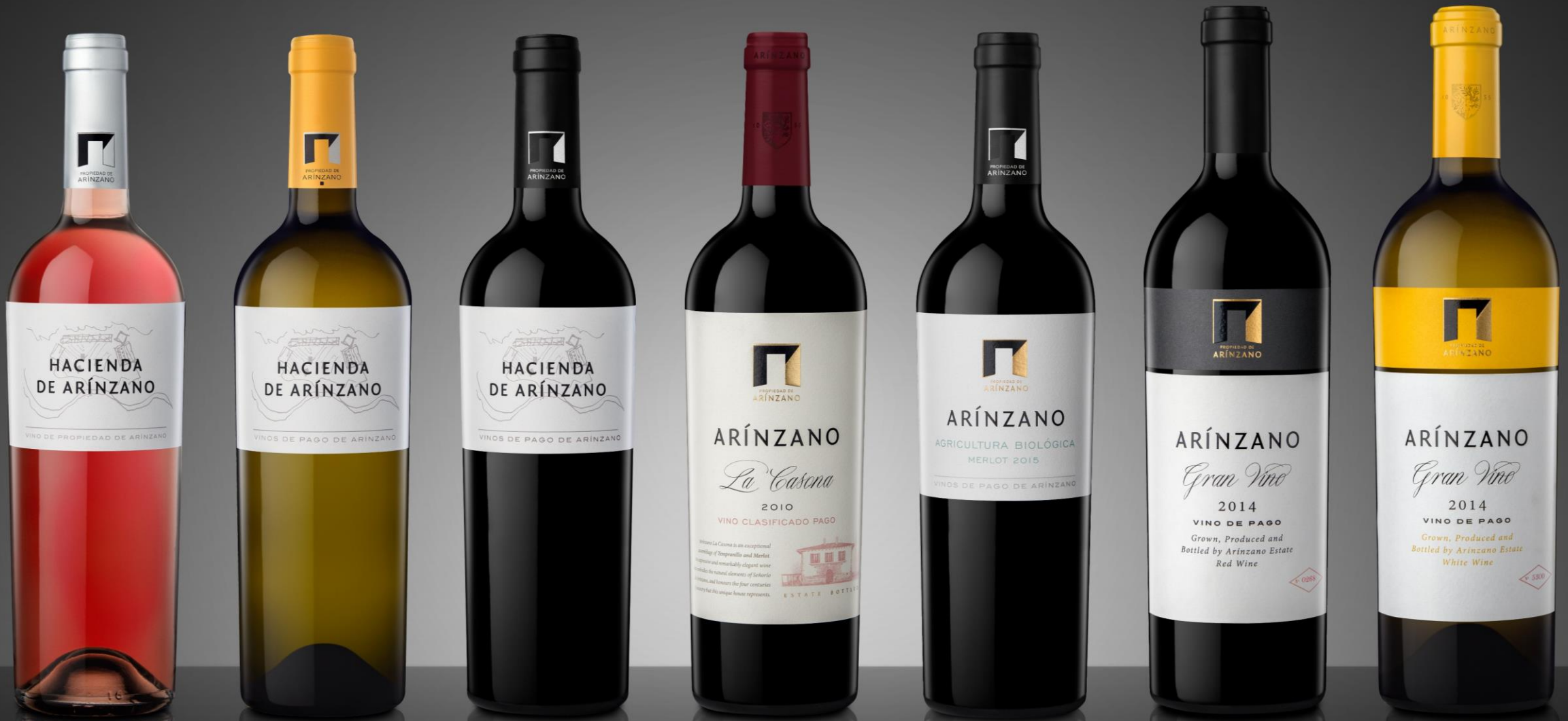
Vinos de alta gama...